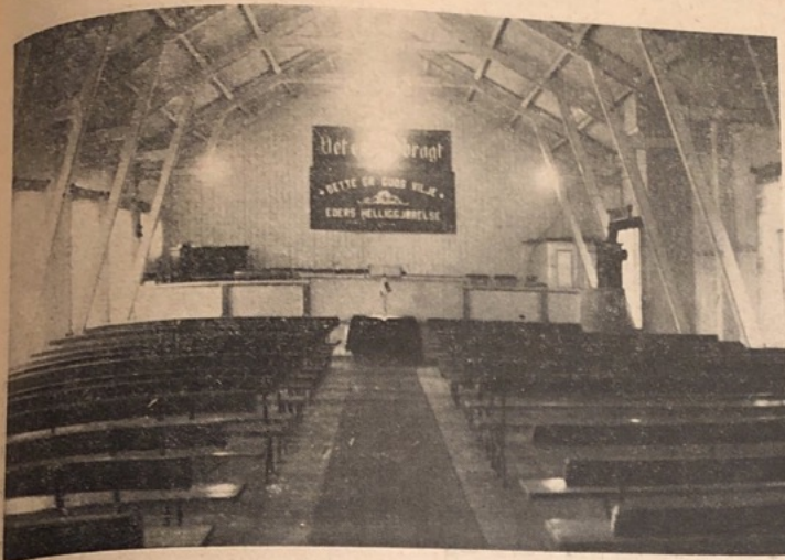
Interior av Betania.

Menigheten i «Betania», Arendal, feiret 35 års jubileum lørdag og søndag 16. og 17. november.