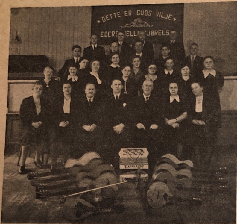
Musikken i Betania.