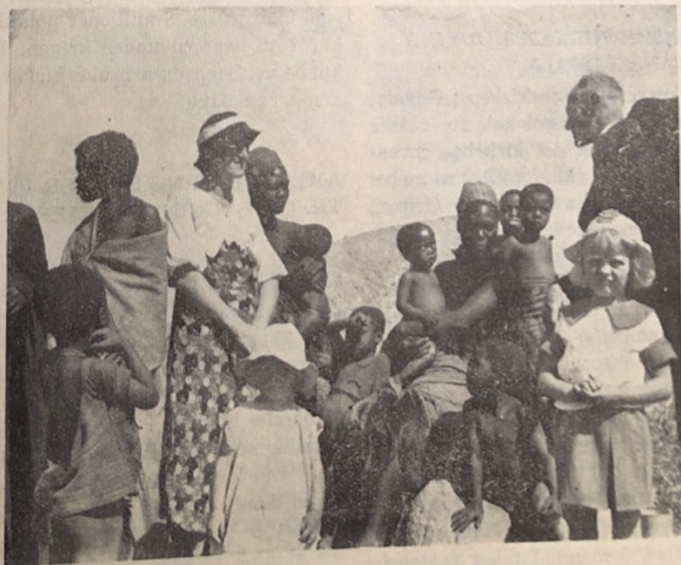
Et besøk på Edwaleni misjonsstasjon i Afrika.