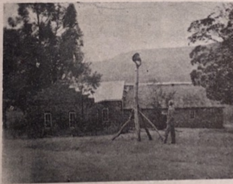
Misjonsstasjon på Edwaleni.

ge. Det har vært gamle nyheter når vi har fått det, men det har vært interessant allikevel. Vi har vært bedrøvet og undret oss over hvordan dere har kunnet klare dere med så lite mat, og vi har ønsket vi kunde sendt noe hjem; men det var jo umulig. Håper det kommer mat og klær til landet så snart som mulig, det er vel mange vanskeligheter selv om krigen er slutt. Vi har ikke hatt rasjonering her i Swaziland; men forskjellige ting har ikke vært å få. Alt har vært og er fremdeles fryktelig dyrt; men vi har hatt rikelig med mat og klær, så vi har meget å