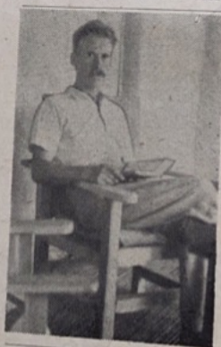
Mannen som venter på hjelp.

Det er ti år siden jeg gikk inn i sykepleien med tanke på misjonen. Men da jeg var ferdig med min elevtid, var det som jeg vegret mig for å gå. Så slog Gud mig med sykdom. Han rørte litt ved kneet mitt, og så