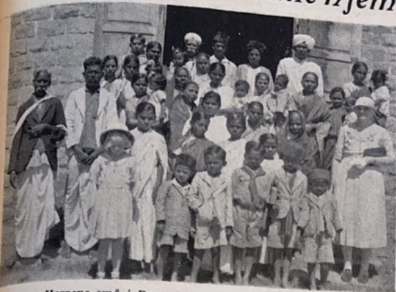
Noen av Herrens små i Bangalore.