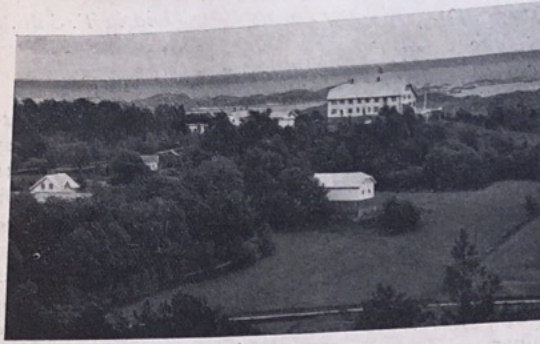
Telefon 116, Grimstad. Postadresse: Pr. Grimstad.

private hus. Nåden har flydd i rike strømme til hjertene som også derved er blitt styrket og det sier apostelen er godt. (Hebr. 13, 9).