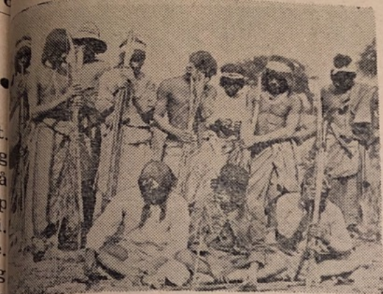
I fullt utstyr.